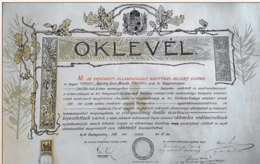
4. kép. Ágfalvi (I.) Imre erdőmérnöki oklevele (1919. május 8.)

A másik különlegesség pedig az volt, hogy az eredeti oklevelét a tanácsköztársasági időszak alatt kapta, így annak bukása után ezt a diplomát bevonták és helyette újat adtak ki, régi dátummal, de új pecsétekkel ellátva. 3